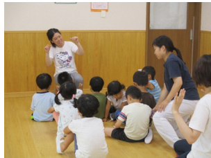
児童発達支援センター

われわれは、若いみなさんの想いと創造力を結集して、発達障がいのある方の支援のために、2014年4月に、都市型生活支援という新しいコンセプトの支援センター“WITH US”を、千葉県柏市で立ち上げました。自閉症者のための直接の支援センターとして、行動障がいのある人にも対応し、日中活動の支援、通過型ケアホームや短期入所による支援、地域生活へ移行するための支援を目指しています。また、全国に先駆けて2017年4月に“地域生活支援拠点あおば”を開設いたしました。