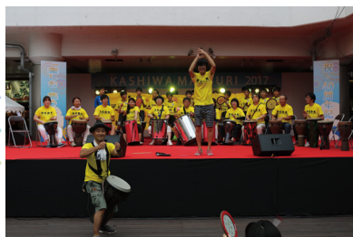
職員が柏まつりに参加（中央）