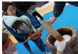
放課後等デイサービス