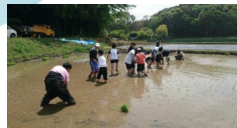
児童事業と成人事業のコラボ（田植え）