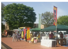
ふれあいフェスタ (主催)