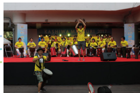
職員が柏まつりに参加 (中央)