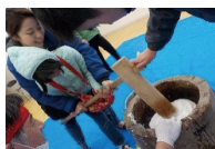
放課後等デイサービス