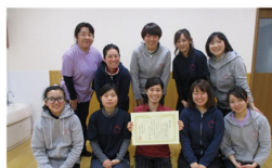
法人内研究会で理事長賞を授与