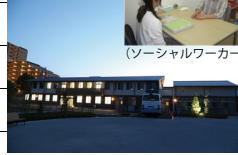
地域生活支援拠点あおば