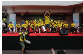
職員が柏まつりに参加（中央）