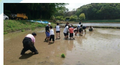
児童事業と成人事業のコラボ（田植え）