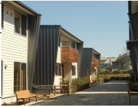
WITH US グループホーム