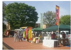
ふれあいフェスタ(主催)