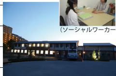
地域生活支援拠点あおば