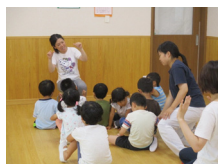
児童発達支援センター

われわれは、若いみなさんの想いと創造力を結集して、発達障がいのある方の支援のために、平成26年4月に、都市型生活支援という新しいコンセプトの支援センター“WITH US”を、千葉県柏市で立ち上げました。自閉症者のための直接の支援センターとして、行動障がいのある人にも対応し、日中活動の支援、通過型ケアホームや短期入所による支援、地域生活へ移行するための支援を目指しています。また、全国に先駆けて平成29年4月に“地域生活支援拠点あおば”を開業いたしました。