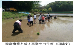
児童事業と成人事業のコラボ（田植え）