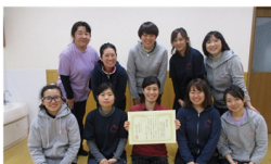
法人内研究会で理事長賞を授与