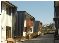
WITH US グループホーム