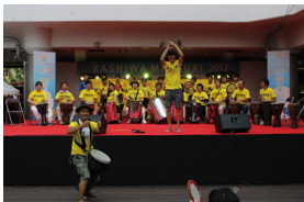
職員が柏まつりに参加（中央）