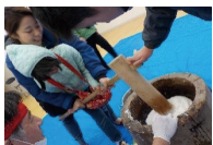
放課後等デイサービス