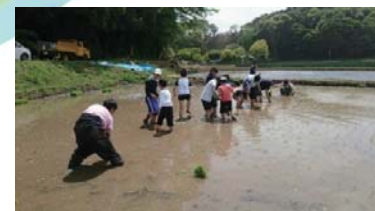
児童事業と成人事業のコラボ（田植え）