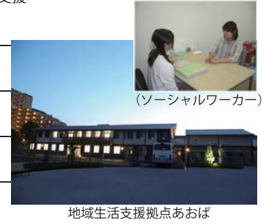
地域生活支援拠点あおば