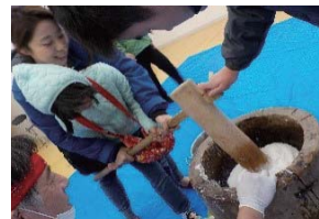
放課後等デイサービス