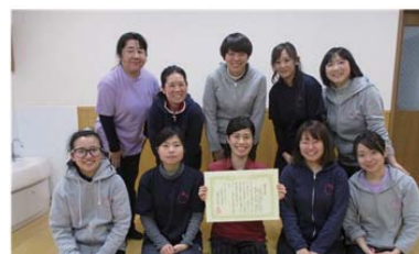
法人内研究会で理事長賞を授与