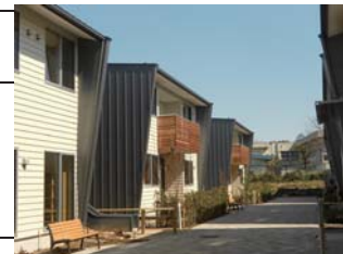
WITH US グループホーム