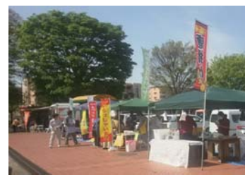
ふれあいフェスタ(主催)

お問い合わせ 社会福祉法人青葉会 法人本部 採用係 千葉県柏市十余二175-66