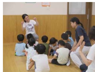
児童発達支援センター

われわれは、若いみなさんの想いと創造力を結集して、発達障害のある方の支援のために、平成26年4月に、都市型生活支援という新しいコンセプトの支援センター“WITH US”を、千葉県柏市で立ち上げました。自閉症者のための直接の支援センターとして、行動障害のある人にも対応し、日中活動の支援、通過型ケアホームや短期入所による支援、地域生活へ移行するための支援を目指しています。また、全国に先駆けて平成29年4月に“地域生活支援拠点あおば”を開設いたしました。